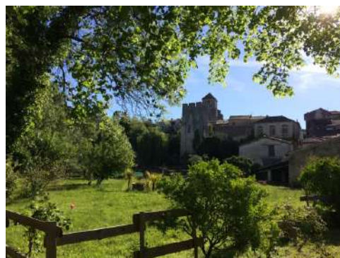
Jardin du Coran Saint Sauvant