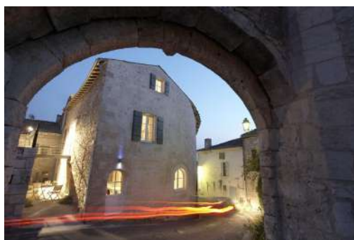
Hotel Design des Francs