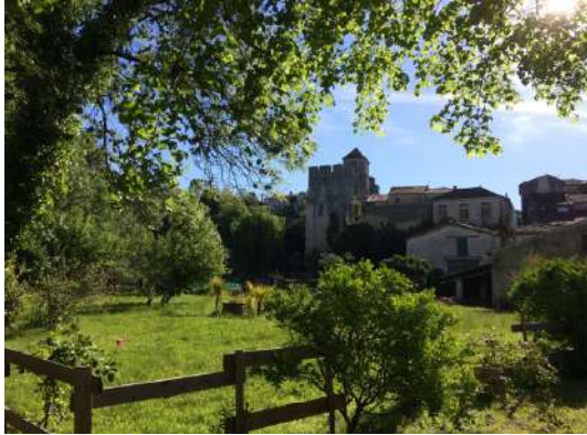
Jardin du Coran Saint Sauvant

☞ Prévoir le pique-nique du midi pour le 1 er jour