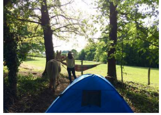
Point bivouac à St Sauvant