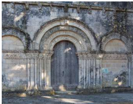
Eglise Le Douhet 2